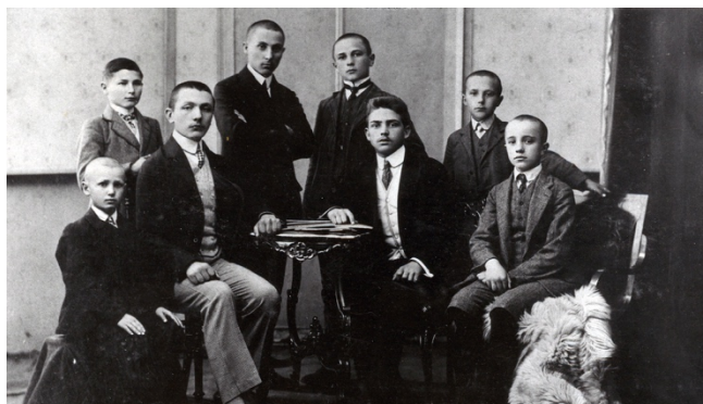
Kollégiumi diákszoba lakói Móricz diákkorában.

Móricz Zsigmond 1890–94 között volt a Debreceni Református Kollégium Főgimnáziumának diákja. Az első évet betegség miatt meg kellett ismételnie (előbb az I. a, majd az I. b osztály tanulója volt). Kezdetben egy tanító családjánál lakott a Miklós utcán, majd 1892 szeptemberétől bennlakos (dárdás) diák lett. Ahogy regényében is megörökítette, a II. emelet 19. coetusában